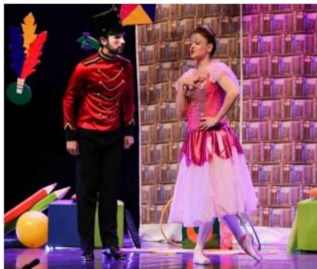
FIGURAS 3 E 4 CENAS DO ESPETÁCULO "AS AVENTURAS DO SOLDADINHO E A BAILARINA", ESPETÁCULO DA CIA DIVERGENTE DE TEATRO