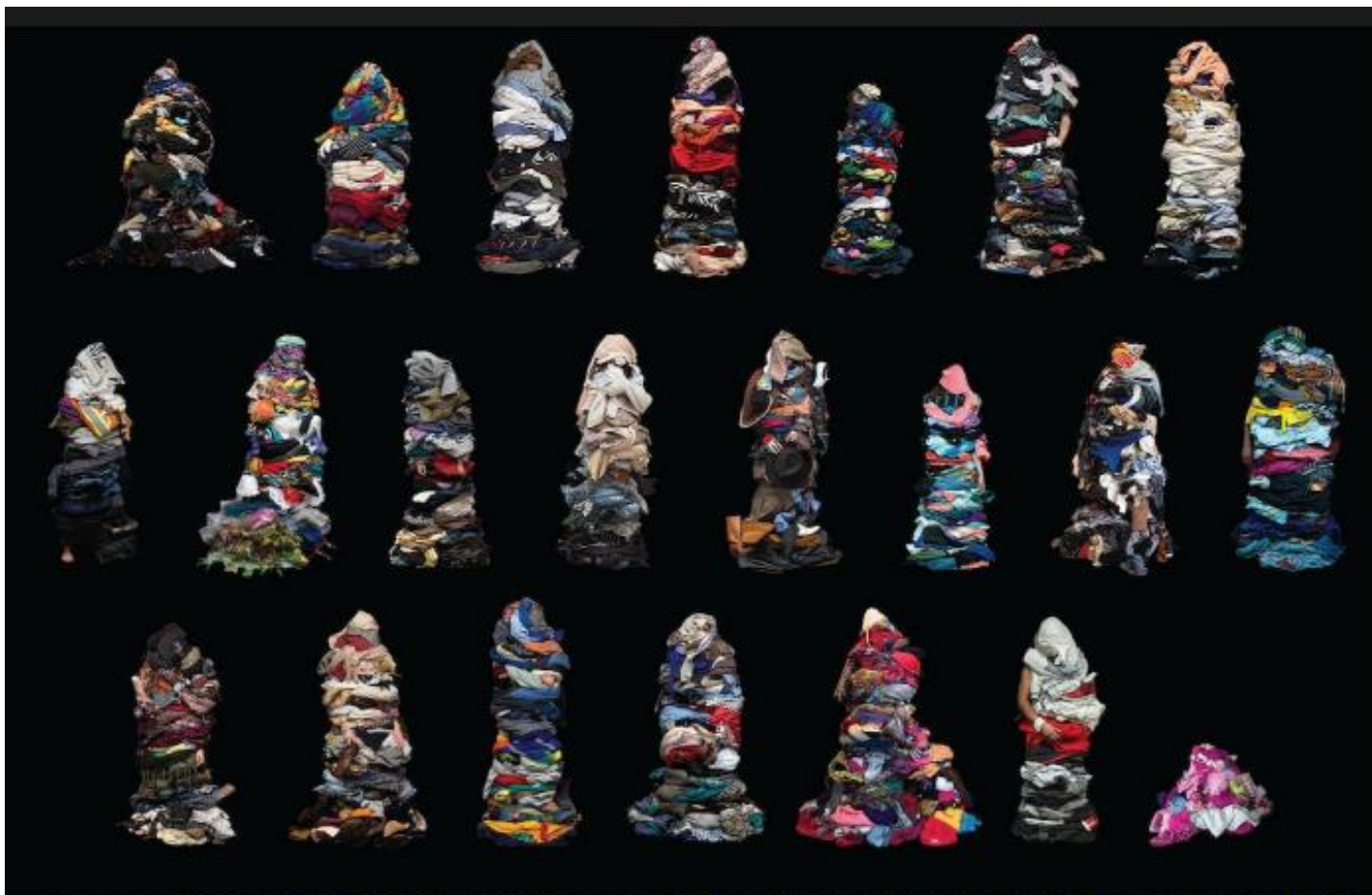
FIGURA 1: FOTOGRAFIAS DA SÉRIE SOFT SHELLS (CONCHAS SUAVES), DE LIBBY OLIVER, INICIADA EM 2017 (IMPRESSÕES DIGITAIS SOBRE PAPEL 109,2 CM 198,1 CM CADA)

Disponível em: https://www.thisiscolossal.com/2018/03/soft-shells-by-libby-oliver/