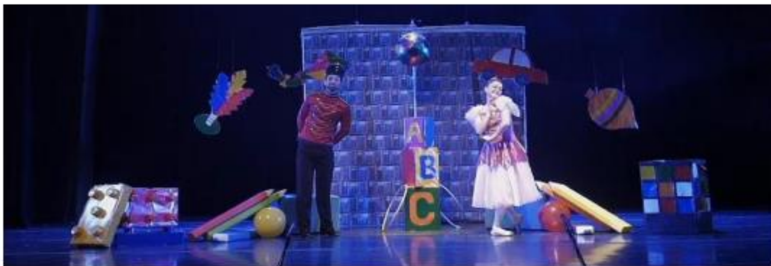
FIGURA 2: ESPETÁCULO "AS AVENTURAS DOS SOLDADINHO E A BAILARINA", CIA DIVERGENTE DE TEATRO