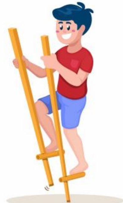
PERNA DE PAU