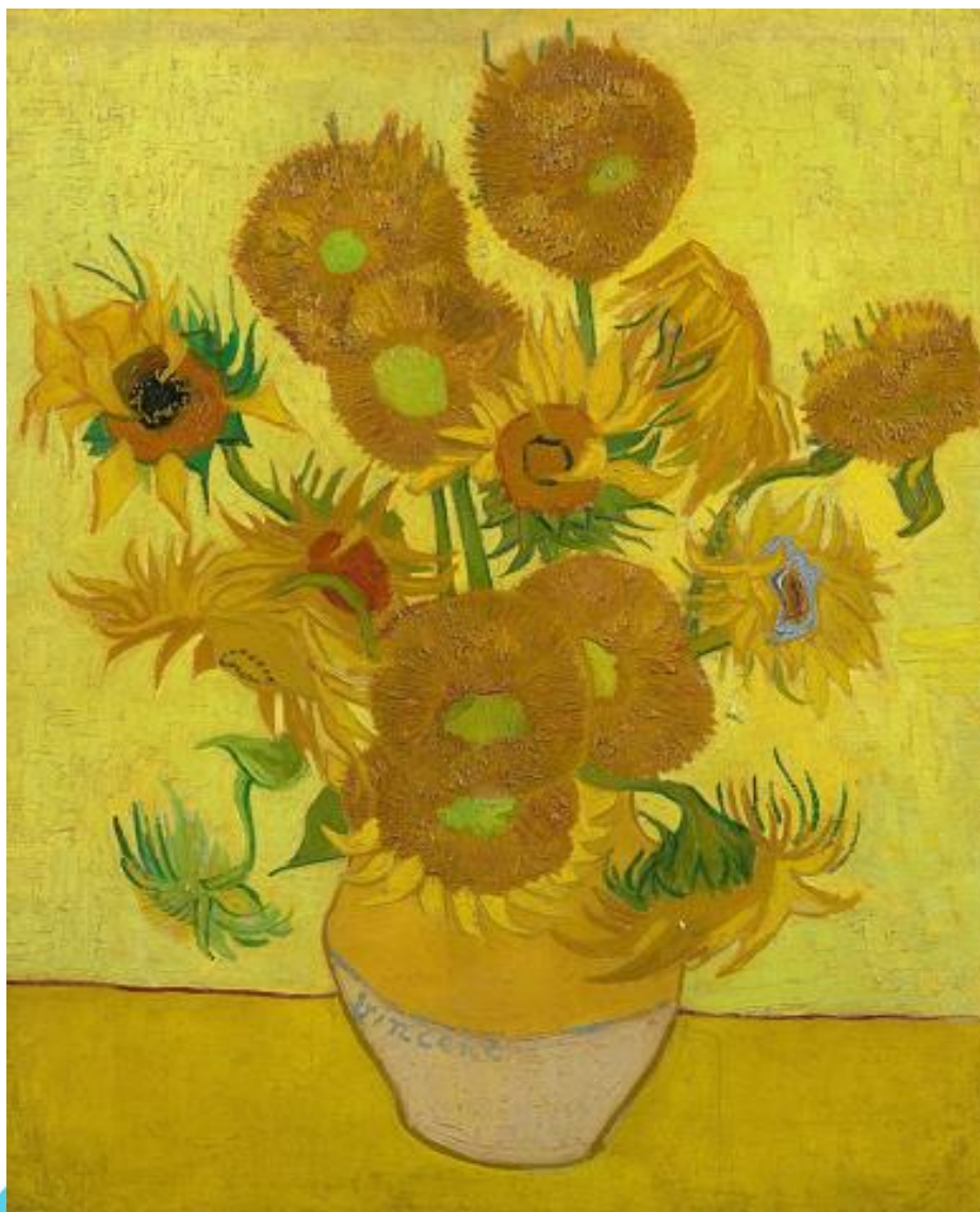
“VASO COM QUINZE GIRASSÓIS”, VINCENT VAN GOGH. ÓLEO SOBRE TELA. 1888

O VASO COM QUINZE GIRASSÓIS FOI FEITO POR VAN GOGH. É UM ARRANJO DE FLORES BONITO E VIBRANTE. QUANDO OLHAMOS PARA ELE, PODEMOS SENTIR A ALEGRIA E A LUZ DO SOL.