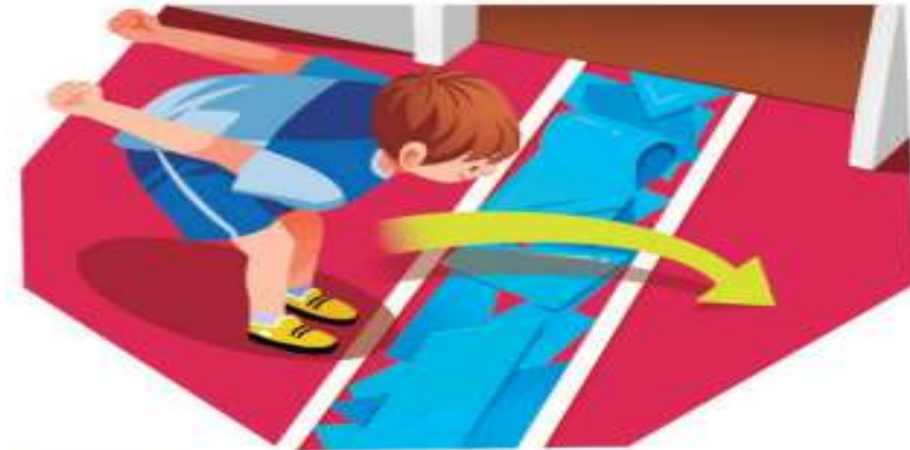
////// Criança saltando um "riacho".

https://www.youtube.com/watch?v=k_TgZZjNayQ