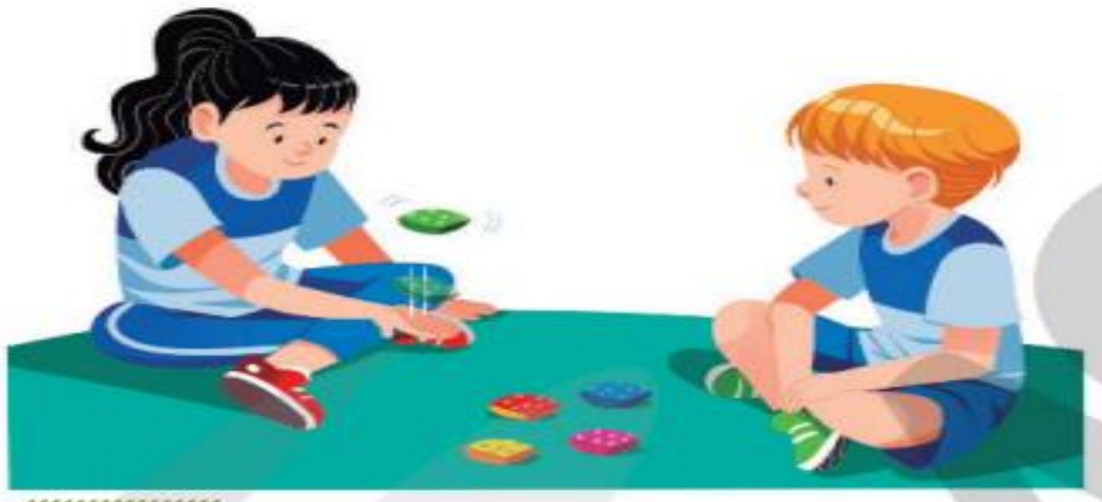
Brincadeira das cinco-marias.

https://www.youtube.com/watch?v=b6RA4xDBWEY